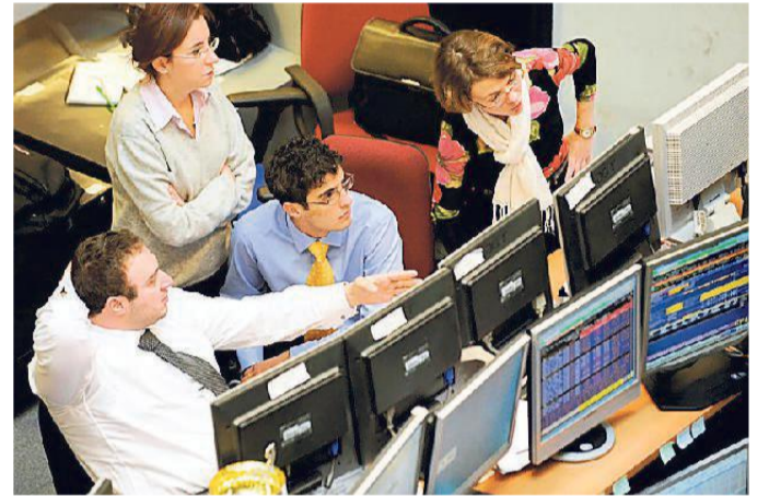
I dati sono raccolti da Ir Top Consulting, partner di Borsa Italiana-Lse Group

giani di cimentarsi nell'impresa e in forme di autoimpiego. La crescita della produzione manifatturiera, dell'export, del valore aggiunto in agricoltura e del reddito disponibile per le famiglie - osserva Landi - ci dicono, infatti, che si vanno consolidando buoni segnali di ripresa, con una positiva e diretta incidenza sull'occupazione. È incoraggiante la flessione del tasso di disoccupazione al 4,7% nel 2016 e un primo trimestre 2017 segnato da un incremento dell'occupazione pari a 3.000 unità, di cui due terzi lavoratori dipendenti».